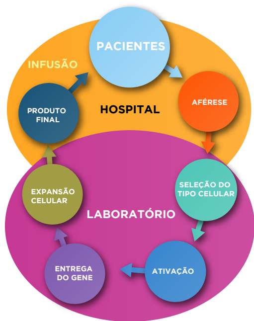
Figura 1. Esquema geral para a produção de células CAR-T descrevendo cada etapa definida.

No geral, a produção de células CAR-T autólogas exige, pelo menos, cinco etapas comuns para a manipulação de linfócitos T, são elas: seleção do tipo celular, ativação, entrega do gene, expansão celular e formulação do produto final (Figura 1; Tabela 1).